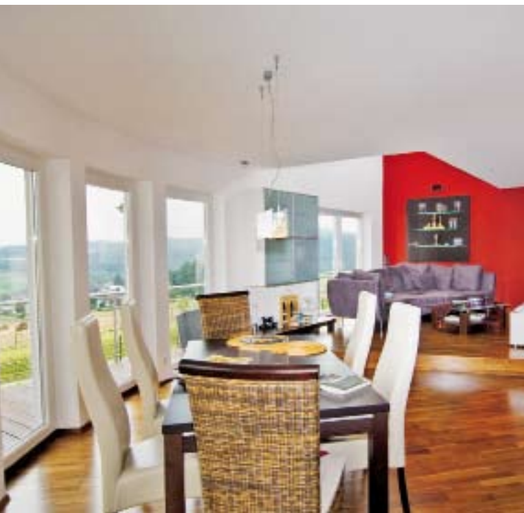
Der Lieblingsplatz von Schrotts ist der Esstisch als Familientreffpunkt im Erdgeschoss. Von hier gibt es einen unverbaubaren Blick durch die halbrunde Glasfront in die Landschaft. Die Wohncke ist über innenliegende Fenstertüren galerieartig mit dem Kinderzimmer verbunden (zwei Bilder rechts oben).

Wesentliches Stilelement im Erdgeschoss ist die verglaste Front im Wohnbereich, welche die runde Form des Balkons aufgreift. Dahinter verbirgt sich der Essplatz, der auch bei schlechter Witterung den Blick in die Natur erlaubt. Mit einer Stufe abgesetzt, schließt sich die eigent-