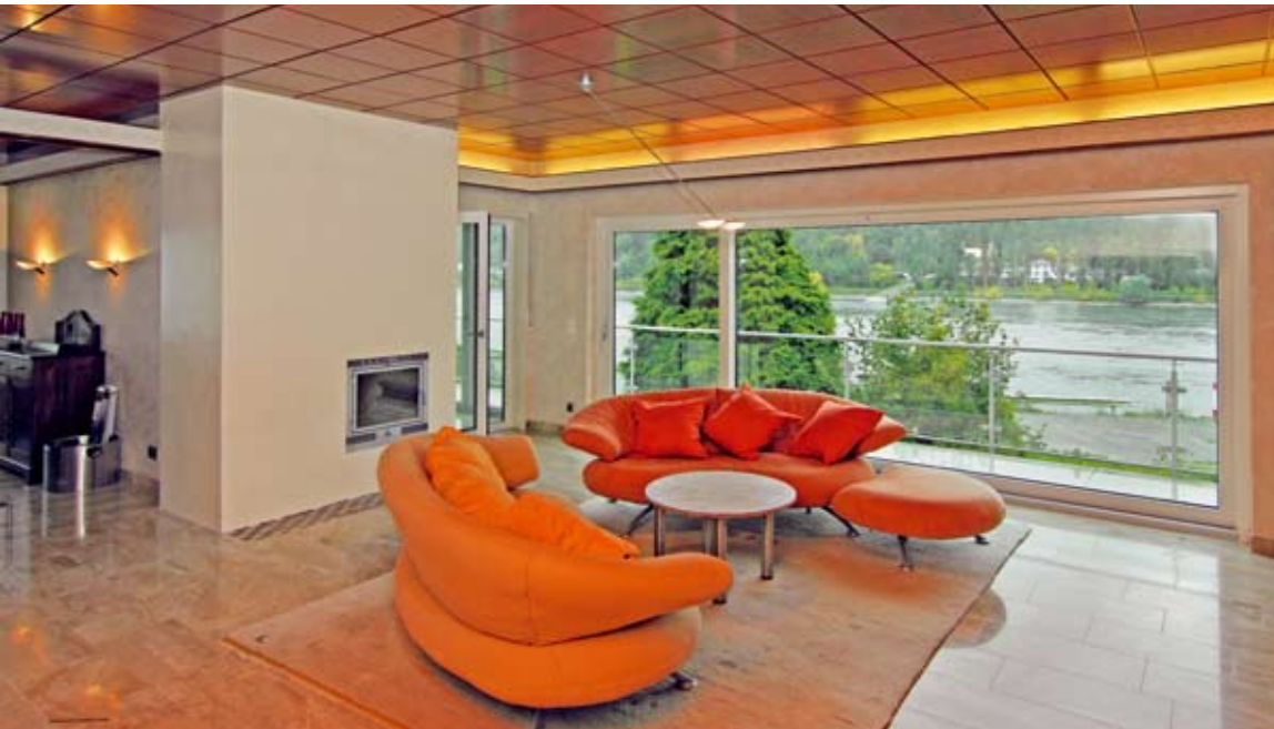
Ein integrierter Kachelofen trennt Essplatz und Wohnbereich.