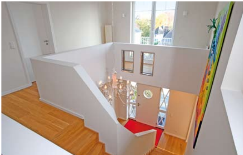
Adressen ab Seite 96

weltwärme dann an die Wohnräume abgegeben. Eine kontrollierte Wohnungslüftung mit Wärmerückgewinnung ist dafür verantwortlich, dass die einmal so gewonnene Wärme nicht durch falsches Lüftungsverhalten verloren geht – sorgt aber gleichzeitig für stetig frische und saubere Luft im Hausinnern, was sich wie geplant im Alltag bestätigte.