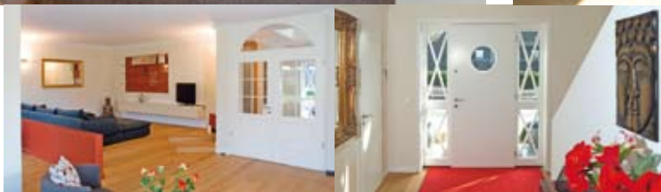
Flexible Raumsituationen: Mit Hilfe von transluzenten Schiebetüren lässt sich die Küche vom Essbereich optisch komplett abtrennen.

Ausreichend Platz für vier Personen und Familienhund, um sich rundum wohlfühlen. Die Raumaufteilung im Haus erfolgte weitgehend klassisch. Im Parterre ist ein großer, offener Wohnbereich über Eck angesiedelt, außerdem werden von der Diele aus ein Arbeitszimmer, und das Gäste-WC erschlossen. Über eine Wendeltreppe geht's nach oben, wo der zentrale Flur drei Rückzugsräume ansteuert. Die Eltern verfügen über ein eigenes Badezimmer sowie eine Tageslicht-Ankleide. Die Jugend hat ein separates Duschbad. Zwischen den Generationen liegen Galerie und Hobbyraum.