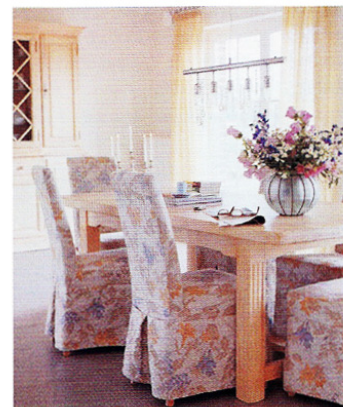
Stilgerecht: Die Stühle im Esszimmer holen mit ihren floral gemusterten Hussen die Natur ins Hausinnere.