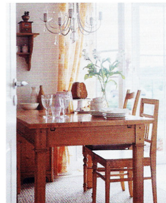
Die hellen Holzmöbel und vielen weißen Accessoires erinnern an den typisch skandinavischen Landhausstil.