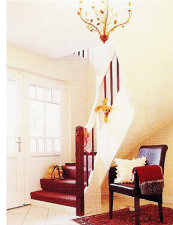
Die halb gewendelte Treppe führt von der Eingangsdielen hinauf zu einer eleganten, großzügigen Empore.

Mehr Infos: Herstelleradresse auf Seite 98